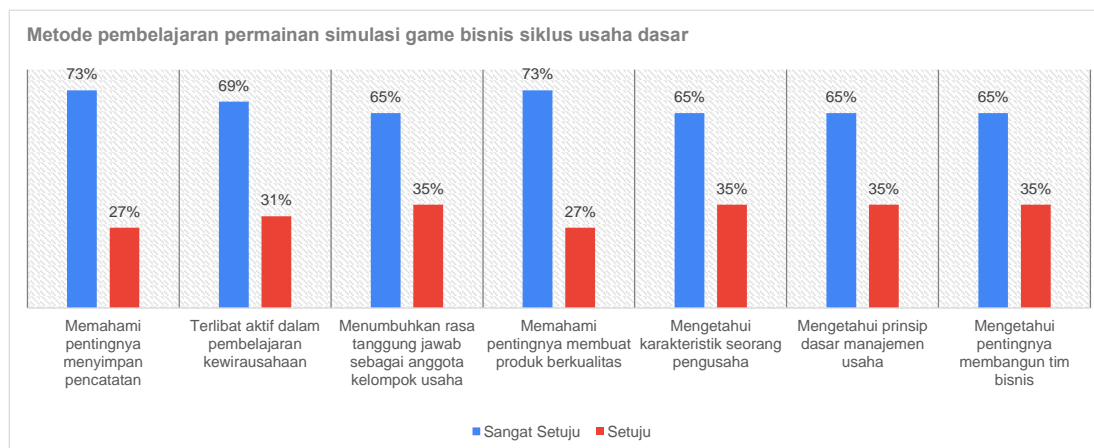
Tabel 2. Aspek Manajemen dan Kewirausahaan

dasar manajemen usaha serta pentingnya membangun tim bisnis dan selebihnya 35% mengatakan setuju.