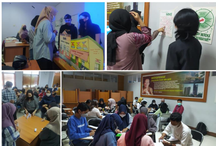
Gambar 2. Suasana simulasi permainan bisnis “Siklus Usaha Dasar”

Melalui simulasi permainan siklus usaha dasar 69% menyatakan sangat setuju dapat memahami dasar siklus usaha yaitu uang masuk dan uang keluar, selebihnya 31% menyatakan setuju. Dari simulasi permainan bisnis responden mengatakan sangat setuju dapat mengetahui perencanaan penggunaan modal yang terbaik sebanyak 65% dan mengatakan setuju 35%. Selanjutnya dengan metode pembelajaran game business siklus usaha dasar dapat memahami pentingnya menjaga arus kas yang positif, sebanyak 65% menyatakan sangat setuju dan 35% menyatakan setuju.